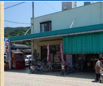
再開後、いつも通り買い物をするお客様