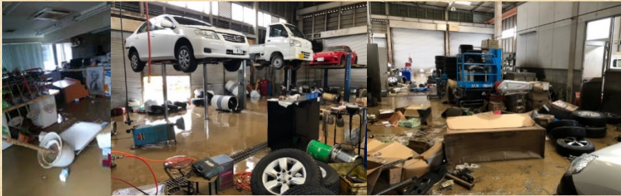
事務所・工場の浸水被害状況