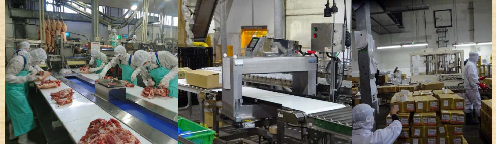
操業再開後の工場内