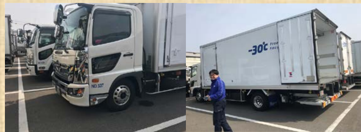
修繕・入替後の車両