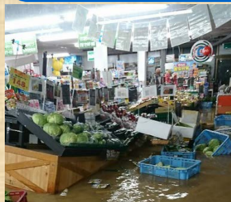
被災後の店内の様子