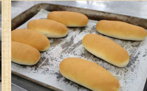
同社で作られ、子供たちに届けられるパン