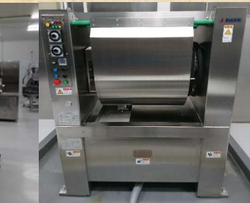
復旧後の工場内と入替や修繕した設備