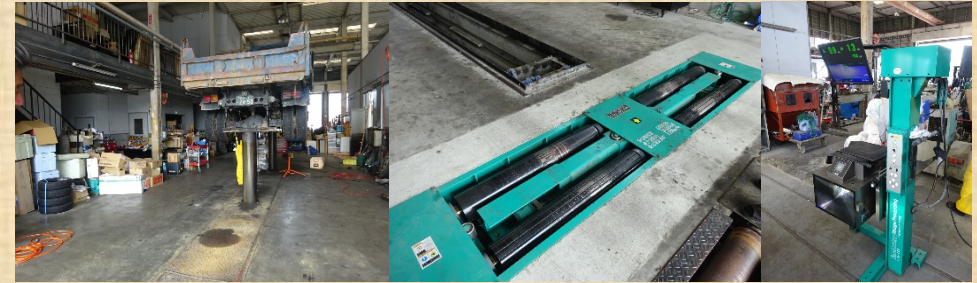
復旧後の工場内と修繕した設備