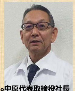
中原代表取締役社長