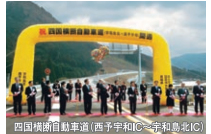
四国横断自動車道(西予宇和IC～宇和島北IC)

また、高速道路へのアクセス道路の整備や主要都市間を結ぶ幹線道路の整備による広域交流ネットワークの形成を進め、地域間の交流や連携の強化・拡充を目指します。