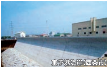
東予港海岸(西条市)

津波又は高潮等の海水による被災被害を最小限にするため、既存海岸保全施設の補強・改良を実施して防災機能を確保するとともに、危機管理意識の向上による避難体制づくりを促進することによって、津波又は高潮等の発生時における人命の優先的な防護並びに背後地に存する住居等財産の保護を促進します。