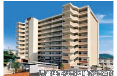
県営住宅砥部団地(砥部町)

誰もが安心して快適に住み続けられる住宅の確保を目標に、耐震性能及びバリアフリー性能が確保されておらず、老朽化が著しい公営住宅団地の再生を推進し、現在の居住水準に見合った良質な公営住宅の整備を行います。