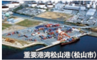
重要港湾松山港(松山市)

また、離島においては、生活必需品の輸送拠点や住民生活に不可欠な交通手段として海上輸送サービスの確保を推進します。