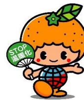
愛媛県地球温暖化防止キャラクター「ストッピー」