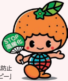
愛媛県地球温暖化防止 キャラクター「ストッピー」