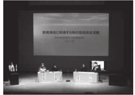
【パネルディスカッションの様子】