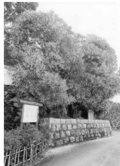
西条王至森寺の金木屋