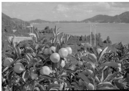
西宇和の温州みかん

この事業に本県からは、「愛媛西宇和の温州みかん」（愛媛県）、「 さいじょうおうしもりじ 西条王至森寺の きんもくせい 金木屋」（西条市）、「内子町の町並と和ろうそく」（内子町）の3件が認定された。