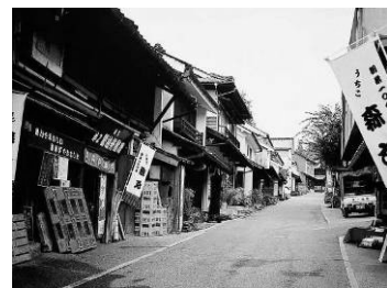
内子町の町並みと和ろうそく