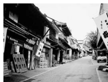
内子町の町並みと和ろうそく