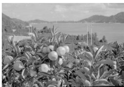
西宇和の温州みかん

この事業に本県からは、「愛媛西宇和の温州みかん」（愛媛県）、「 さいじょうおうしもりじ 西条王至森寺の きんもくせい 金木屋」（西条市）、「内子町の町並と和ろうそく」（内子町）の3件が認定された。