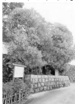
西条王至森寺の金木屋