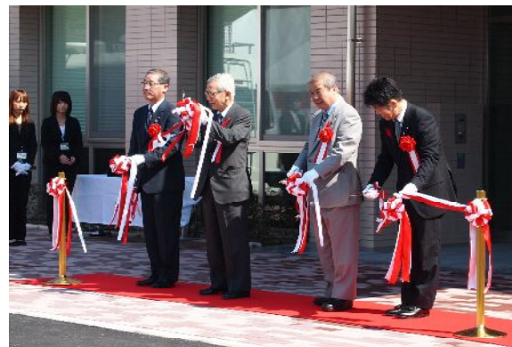
※10月7日に実施された開所式の様子