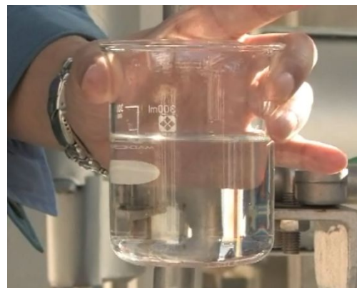
試験製造したバイオエタノール