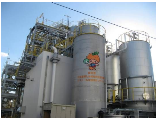
バイオエタノール製造実証プラント外観

このプラントは、日量5klのバイオエタノールを製造することができ、できたバイオエタノールをガソリンに混ぜて自動車用燃料として使用した場合、1日当たり6.4トンの二酸化炭素削減効果が見込まれます。