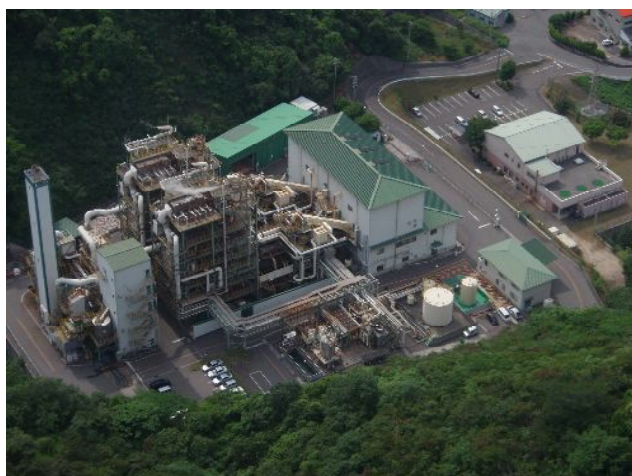
微量PCB汚染絶縁油専用保管タンク