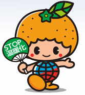
愛媛県地球温暖化防止 キャラクター ストッピー