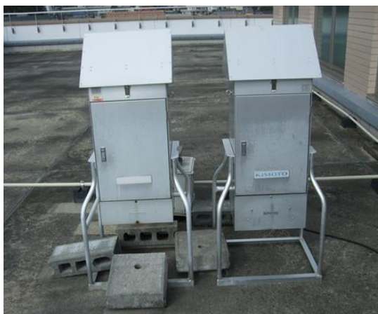
図2 ハイボリュームエアサンプラー