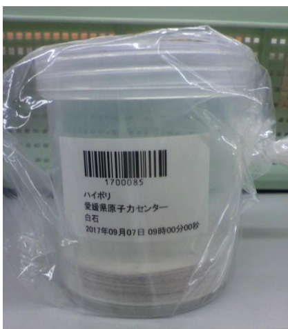
図5 U-8 容器(大気浮遊じん)