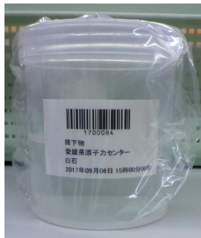
図6 U-8 容器(降水物)