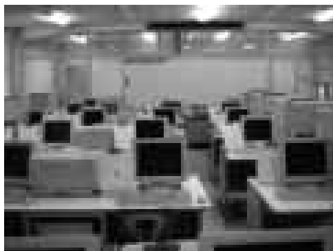
[電子計算機械実習室]

本年度の監査は、松山商業高校の全容について検討することを課題とはしていない。監査の対象は重要物品である IT 関係をめぐる設備投資についてのみである。まずは、商業高校のコンピュータールームの写真をみていただきたい。左である。右側の写真は LL 教室である。