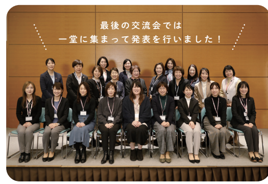
最後の交流会では一堂に集まって発表を行いました！