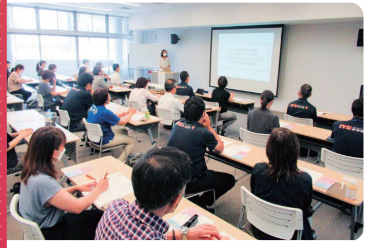
当日は多くの事業所・自治体から、女性の部下を持つ上司が参加しました。(写真はIYO夢みらい館(伊予市文化交流センター)にて)