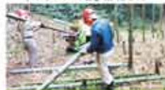
12 市橋里山ボランティア会 里山の環境保全の推進と里山整備・広域連携の推進活動