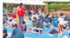
37 南宇和地区林業振興協議会 木とのふれあひ教室（親子手作り木工広場）