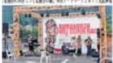
22 合同会社 久万郡 木トラス制作・普及プロジェクト