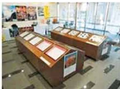
「森の博物館」開催状況