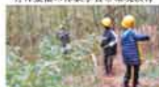
14 NPO 法人 INVISIBLE 森林・里山の自然環境・里山の魅力を伝える活動