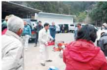
チェーンソーの研修