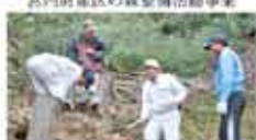
8 森の国さくらの会 森の国花と緑のまちづくり事業