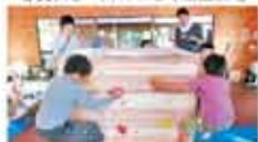
27 特定非営利活動法人自然環境教育センター みんなが元気に暮らすための環境づくり活動