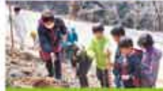
1 上島町 積善山の防災事業