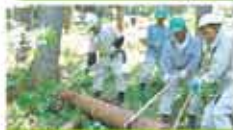
1 特定非営利活動法人環境生活指導センター 森林・自然の豊かさよび野営地・自然の再生推進事業