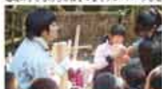
29 愛媛県森林組合職員連盟本部 森とふれあう教室