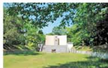
丸山墓地(松山市北斎院町)