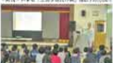
46 中村敬治 西子原水きのご栽培学習会