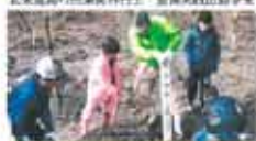
6 名神古岩屋を守り育てる会 古岩屋公園リニューアル事業