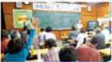
42 えひめ森の家内人会 平成 25 年度森への語り推進事業