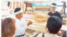
17 福野今治地区「地産地消の家づくり」推進協議会 福野今治地区「地産地消の家づくり」推進事業