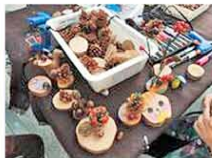
「種で遊ぼう」実施状況