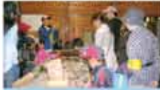
49 森林・自然体験活動連絡会 森林・自然体験活動推進事業