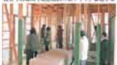
18 伊予地区「地産地消の家づくり」推進協議会 伊予地区「地産地消の家づくり」推進事業