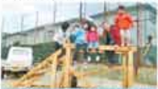
41 NPO 松山自然遊歩道会 森林の重要性を伝える自然環境教育推進事業