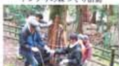
5 愛媛の海山川 北条屋敷の歴史資料再生・普及交流活動事業