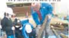
47 にはま環境協議会 森を取り戻そうプロジェクト