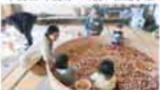
43 Hug 育 森の木育ひろば