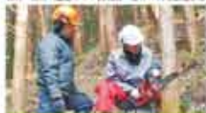
2 えひめ学生森林ボランティア えひめの学生の森づくり