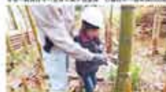
13 かくや館 竹林整備の体験学習と環境教育