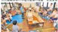
21 瀬戸内アーキテクチャーネットワーク 「瀬戸内」の建築文化の継承と「瀬戸内」の魅力を伝える活動