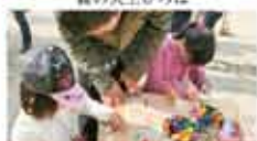
31 ワニナルアートカンパニー 木のおもしろ家器制作広場