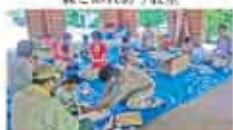
30 Hug 青 森の木工ひろば