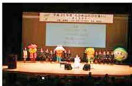
グランドフィナーレ

森林環境税の透明性・公平性を確保するため、愛媛県森林環境保全基金運営委員会を開催(3回)し、事業の調査・審議を実施しました。