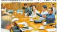
20 愛媛の海山川 公共建築物等の木造化整備の調査・普及事業