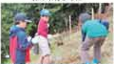
44 都会と田舎を結ぶ食育ネット 森を学び、里・川・海、そして都を結ぶ食育ネット