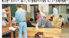
35 藍川中学校 PTA 地元材を使った木製ベンチ作り事業