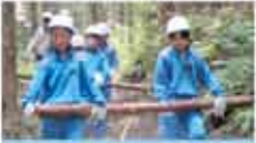
39 朝倉の森を育む会 朝倉の森を守ろう、育てよう