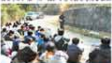
45 さんきら自然塾 〈現代〉による「自然多様性の森」推進プロジェクト