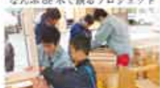
33 久万林業まつり実行委員会 久万林業まつり親子木工広場