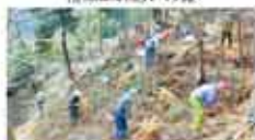
4 えひめ森の案内人会 ダンングリの森づくり活動