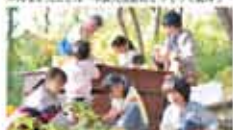
28 NPO 松山自然環境教育センター 地域の子どもたちと暮らすための環境づくり活動