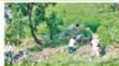
11 公益財団法人オイスカ愛媛県支部 「オイスカの森」in えひめ