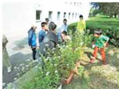
「森の学校」実施状況