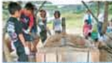
50 伊方町女性林業研究グループ 自然とのふれあい事業