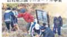
7 宮内財産区 宮内財産区の高齢者活動事業