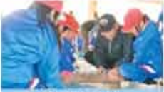
38 夢遊友ずい 森林環境教育