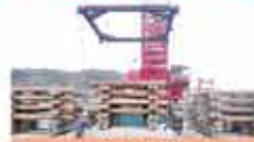
2 伊方町 木製増殖機設置事業