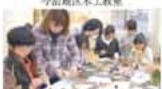
25 特定非営利活動法人 JMACS 産女学会 木工教室