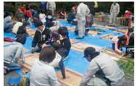
森林教室「間伐材を使った工作」