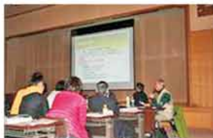
県民代表者による話題提供