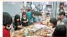
36 八西林業研究グループ 親子木工広場開設事業