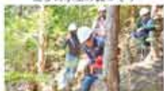
3 清珠千年の森をつくる会 清珠ふれあいの森