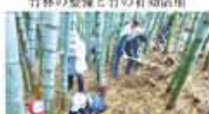
10 竹林をよくなる会 放置竹林整備と竹利用文化の継承