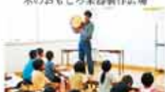
32 愛媛県木材産業振興センター なんぶ de 木で語るプロジェクト