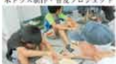
23 あそびじゅく トムソーヤ トンゴ木工教室