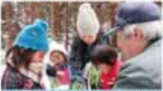
40 特定非営利活動法人 自然環境教育推進ことば 加賀野の自然環境を伝える自然環境教育推進事業