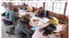
19 竹野町代行（7/17-21）と（7/27-31） 石浜町木造建築物と木に楽しむアートワークショップ