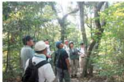
樹木を活用した自然観察会