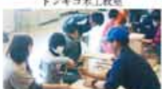
24 今治地区林業研究グループ協議会 今治地区木工教室