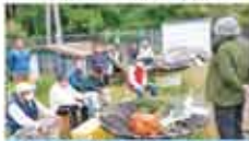
51 特定非営利活動法人 坂 稚芽栽培による森林環境教育