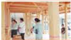
16 西条地域地産の家づくり推進協議会 西条地域地産の家づくり推進事業