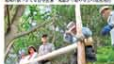
15 えんとつ山倶楽部 「えんとつ山」里山整備