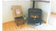
3 西予市 西予市東水質バレット生産利活用促進事業