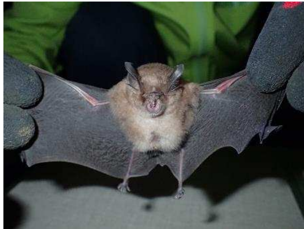
コキクガシラコウモリ Rhinolophus cornutus

県内の海岸域の岩場などで確認されている。県内での生息確認地は限られており、絶滅が危惧される。