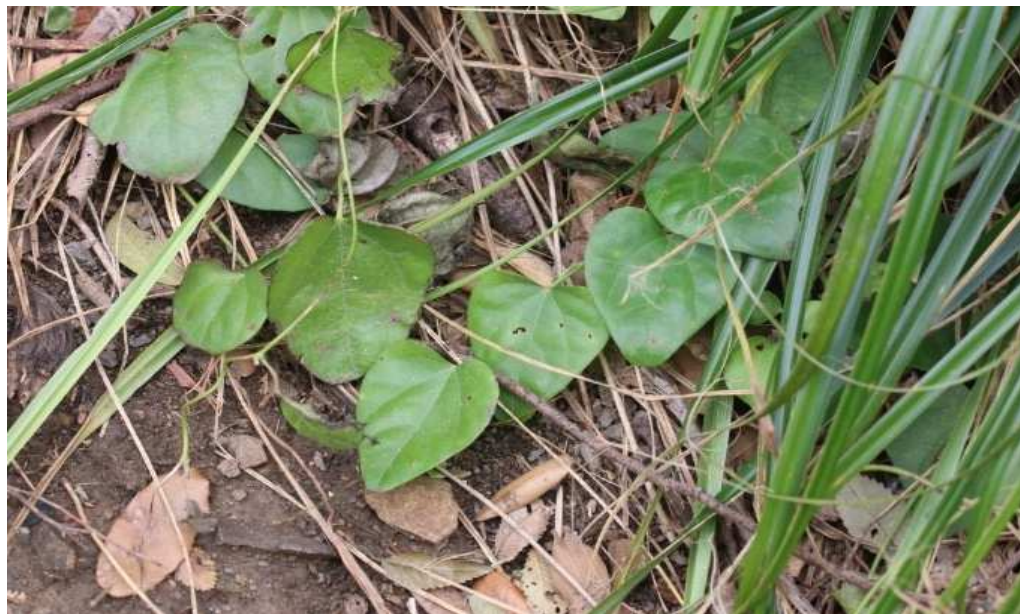
ミヤコジマツツラフジ (県絶滅危惧 I B類)