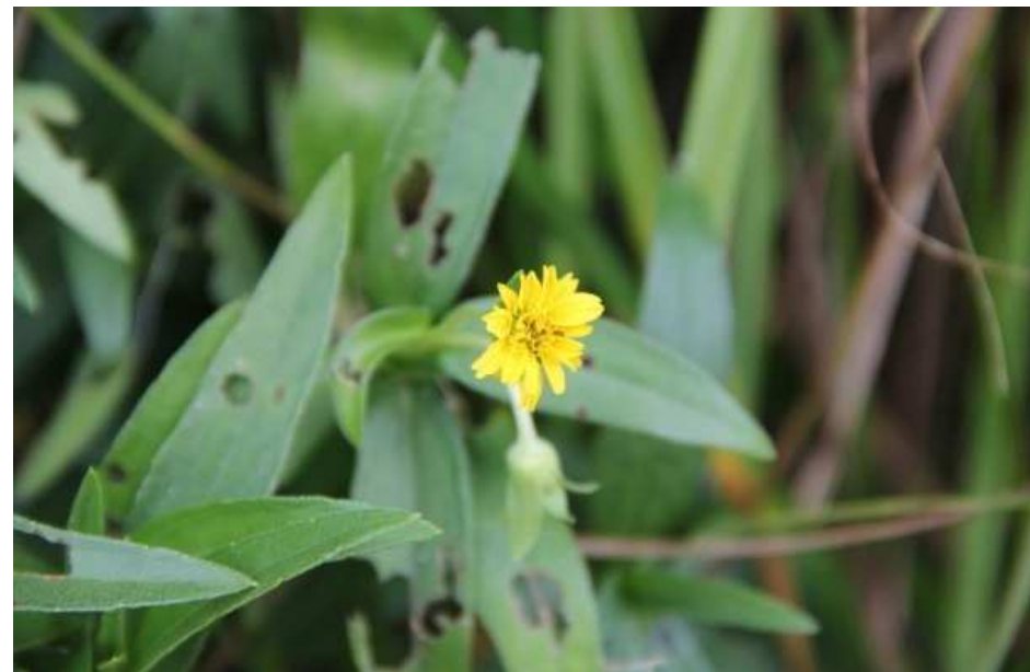
クマノギク (県絶滅危惧 I B類)

本種はツツラフジ科のつる性の木本で、林縁に生育している。県内のものは本種の分布の東限にあたり、植物地理学上重要である。本種は佐田岬と宇和島市において記録されている。日振島での記録があったが、近年御五神島でも確認され、さらに今回の調査では本浦の2か所で本種が確認された。県内での生息確認地は限られており、絶滅が危惧される。