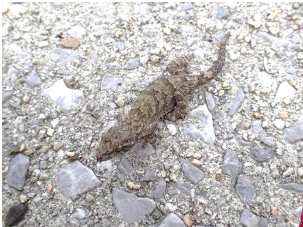
タワヤモリ (県準絶滅危惧種) Gekko tawaensis

県内の海岸域の岩場などで確認されている。県内での生息確認地は限られており、絶滅が危惧される。