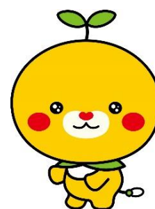
愛媛県 こみきちゃん