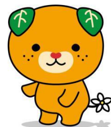
愛媛県イメージアップキャラクター みきやん

80 項目に及ぶ調査を行い、その人に必要なサービスの度合い（「障害支援区分」）を測り、その度合いに応じたサービスが利用できるようになっています。