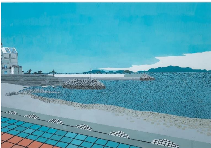
「夏の海 伊予市森の浜」