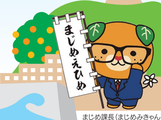
まじめ課長(まじめみきゃん)

建設産業は、日々の暮らしや地域の産業を支え、時には災害から人々を守るために活動する、地域に欠かすことのできない重要な産業です。人々の暮らしをより豊かにするために日々がんばっている建設業の仕事について、皆さんにご紹介します。