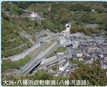
大洲・八幡浜自動車道(八幡浜道路)

道路やトンネル、ダムなどの土木施設、学校や病院、ビルや住宅などの建物を造り、それらの維持・管理をしていくことで、地域の豊かな暮らしを支えています。