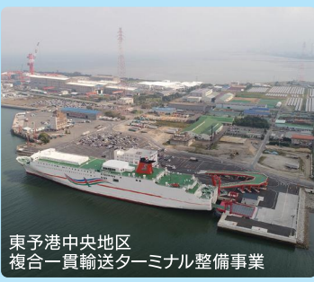
東予港中央地区複合一貫輸送ターミナル整備事業

人や物の円滑な移動のための拠点である空港や港湾、道路、鉄道など、地域の産業・経済活動を支える社会基盤を整備するとともに、地域における多くの人の雇用も支えています。