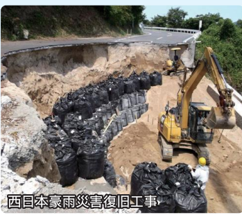
西日本豪雨災害復旧工事

集中豪雨や地震といった災害が発生した際には、いち早く現場に駆けつけ、人命救助のための障害物の除去や河川のはん濫を食い止めるなど、応急復旧活動を行います。