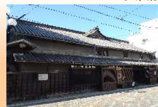
『宮内家住宅』 (国登録有形文化財)