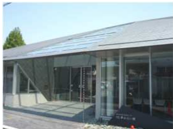
伊予市文化交流センター IYO夢みらい館