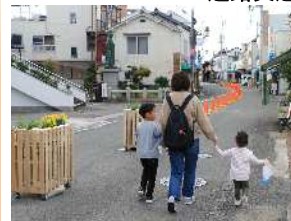
道路交通社会実験実施