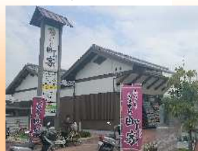
手づくり交流市場『町家』