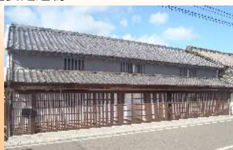
『木村家住宅』 (平成30年助成金整備)