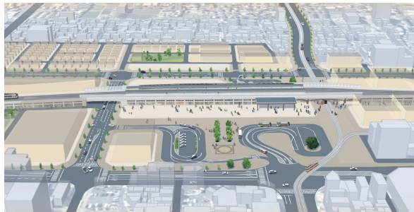
JR松山駅周辺（完成予想図）