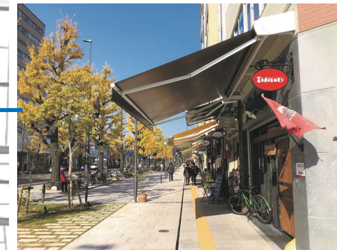
花園町通り（整備済）