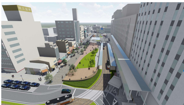
松山市駅前広場（完成予想図）