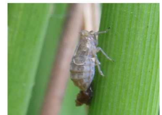
トビイロウンカ 短翅雌成虫