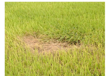
トビイロウンカによる 坪枯れ