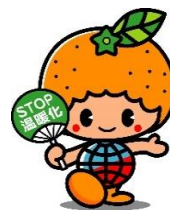
愛媛県地球温暖化防止キャラクター「ストッピー」