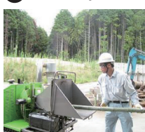
移動式粉砕機で破碎。(チップ化)