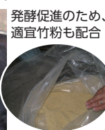
発酵促進のため、適宜竹粉も配合