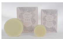
スキンケアアソープ