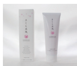
クレンジングジェル