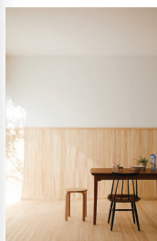
壁・床： プレーン松無節