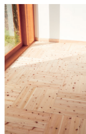
床： はれるんです松生節