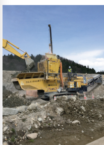
汚泥の混合土質改良