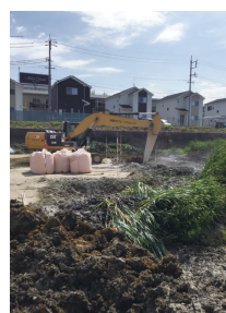
沼地の地盤改良固化