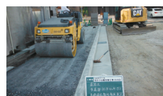
インターロッキングの 路盤材に使用