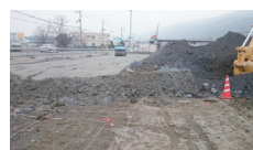
JAガソリンスタンド造成工事 田んぼの肥土を改良して造成