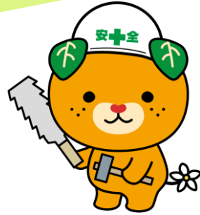
愛媛県イメージアップ キャラクター みきゃん

ラダーゲッターは、ヒモでつながっている2個のボールをラダー（はしご）に向かって投げ、ボールがラダーに引っかかると得点になるゲームです。