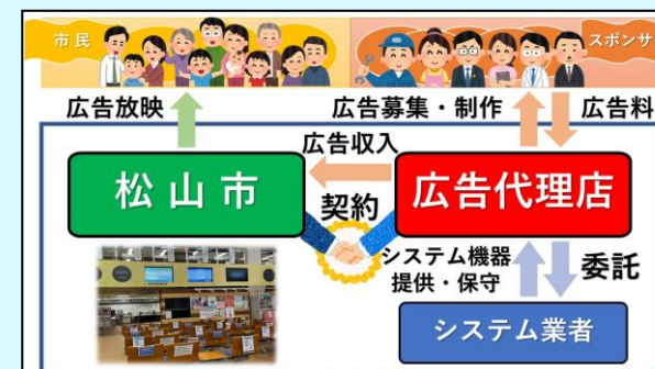
広告付き窓口案内システム スキーム図