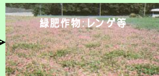
緑肥作物: レンゲ等