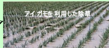
アイガモを利用した除草

機械除草技術 除草用動物利用技術 生物農薬利用技術 対抗植物利用技術 マルチ栽培利用技術 被覆栽培技術 フェロモン剤利用技術 温湯種子消毒技術 抵抗性品種栽培・台木利用技術 熱利用土壌消毒技術 光利用技術