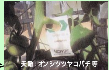
天敵: オンシツヤコバチ等