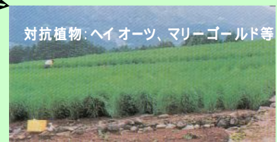
対抗植物: ヘイオーツ、マリーゴールド等