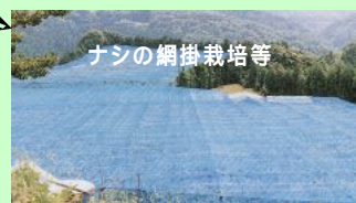
ナシの網掛栽培等