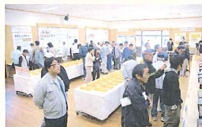
早生みかん果実コンクール