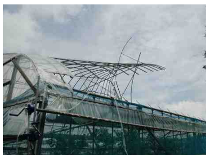
風を受けアーチ部が浮き上がった状態

谷、サイド、妻面の開放が十分でないことから、風の抜け道が無く、天部に風を受け浮き上がっている。（写真、 ） サイド練のサイド側アーチ部が開放できないことから風を受け、サイド練の天が風を受けめくれている。（写真 ） フルオープン化したハウスでも、巻き上げ部が残っている場合にその部分が風を受けアーチ部が曲がっている。（写真 ）