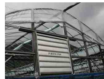
妻面は上部の 部まで出来る限り開放する。