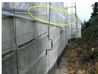
妻面が十分開放されていない状態