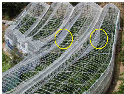
フルオープン化したか、完全に巻き上げられない部分が風を受け、アーチ部が曲がった状態