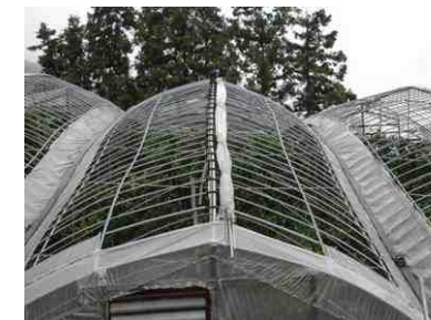
フルオープン化する場合でも、完全に巻き上がらない部分は天で縛り固定する。