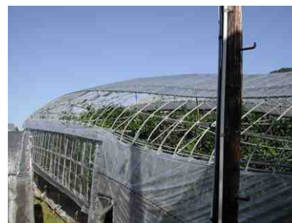
サイド練サイド側アーチ部のフィルムを巻き上げた状態