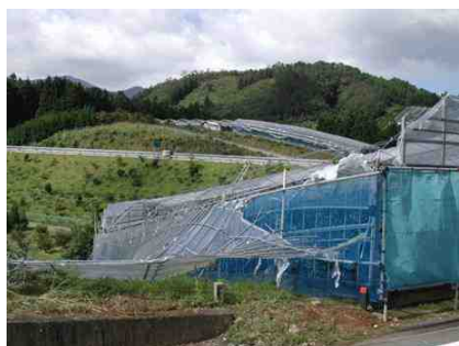
風を受けサイド練の天部がめくれた状態