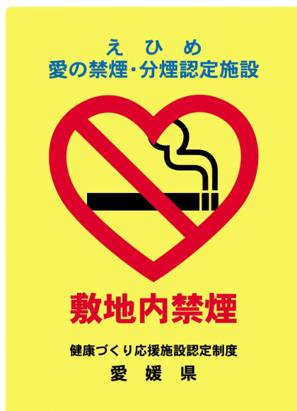
敷地内禁煙の認定証