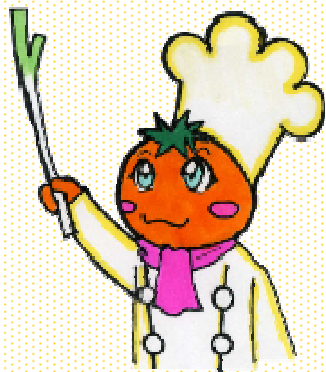
弁当づくりキャラクター 「バランス伊予ちゃん」

中予地方局では、若者の健康維持増進及び食育の推進のため、バランスのよい「食べさせたい・食べたい弁当」を募集します。皆さんからいただいたアイデアをもとに、管理栄養士などの専門家が弁当を作成し、審査で選ばれた弁当を県や大学で広報し、バランス食の普及や野菜摂取向上を目指します。是非ご応募ください。