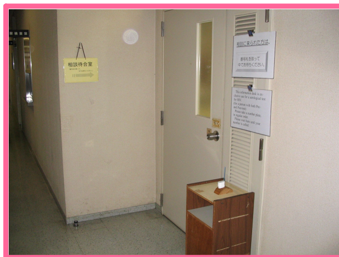
受付です。まず番号札を取って、部屋の中でお待ちください。