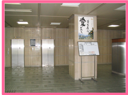
1階玄関ホールです。受付は右手のトイレ前です。