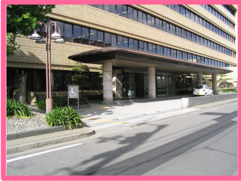
愛媛県松山保健所です。中予地方局の1階にあります。