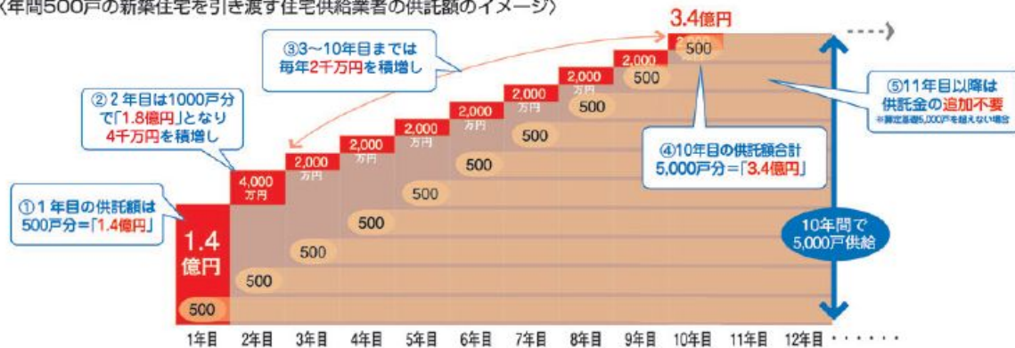
〈年間500戸の新築住宅を引き渡す住宅供給業者の供託額のイメージ〉